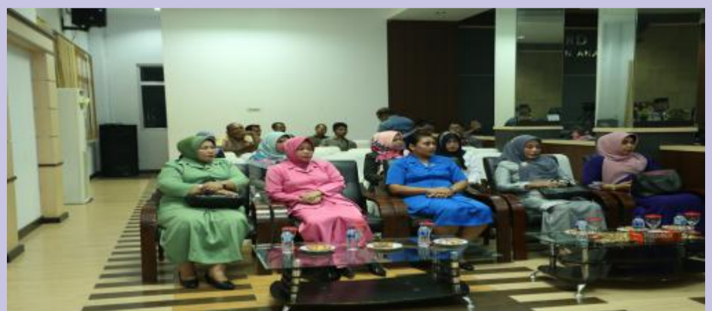
Penggerak PKK Anambas mendengarkan laporan akhir Ketua Pansus SOTK.

Abadikan Momen Spesial Anda di BATAMTODAY.COM Galley Foto