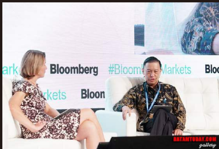
Kepala BKPM RI Thomas Lembong saat menjadi pembicara di kegiatan IMF -WBG 2018