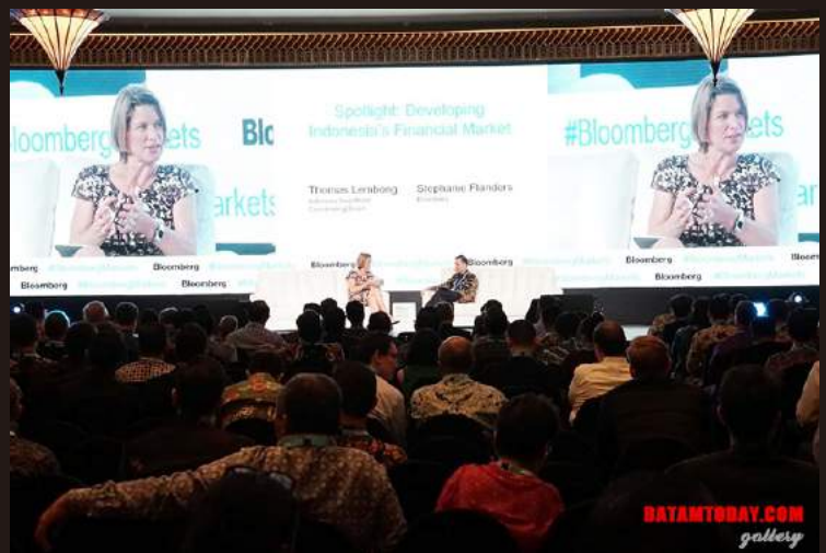
Suasana saat kegiatan IMF -WBG 2018

Abadikan moment spesial Anda di BATAMTODAY gallery untuk pemesanan hubungi: Telp: (0778) 7482-514 Email : redaksi.batamtoday@gmail.com