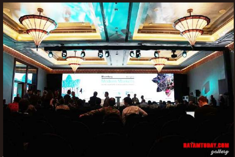
Suasana saat kegiatan IMF -WBG 2018