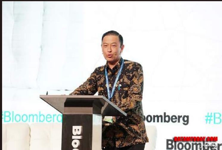
Kepala BKPM RI Thomas Lembong saat menyampaikan sambutan