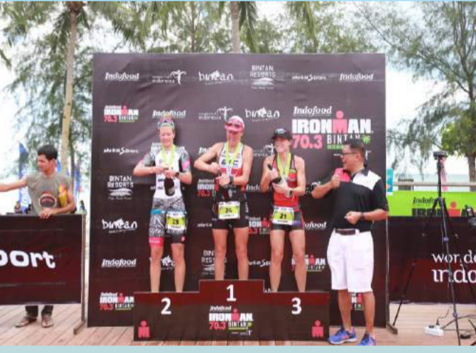
Winer Kategori Wanita