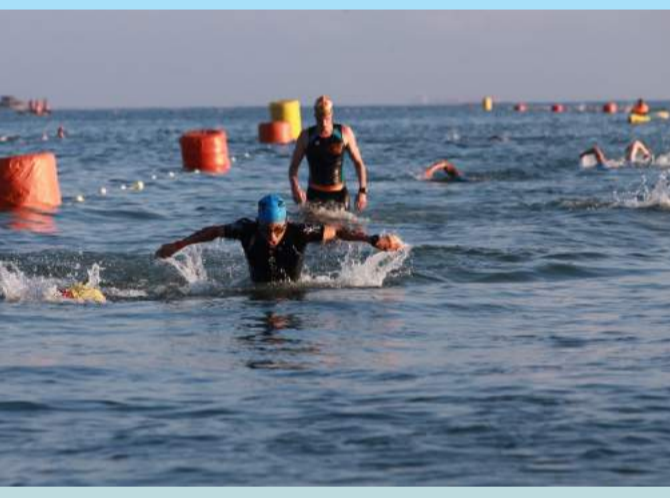
Berenang merupakan rintangan pertama pada Ironman 70.3