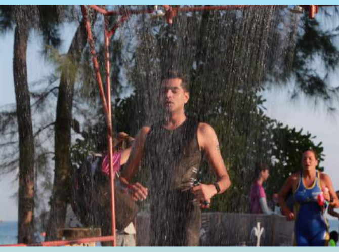
Atlet mandi air pancur setelah berenang dan menuju ke tempat sepeda

Didorong oleh kepuasan atlet yang mencapai 90 persen dalam survei Ironmen 70.3 global 2016, Bintan menempati posisi pertama di Asia dan posisi ke 3 di dunia, berada dibelakang Jerman dan Prancis. Iven ini mencatat pertumbuhan 25 persen yang luar biasa dalam pendaftaran tahun ini. *