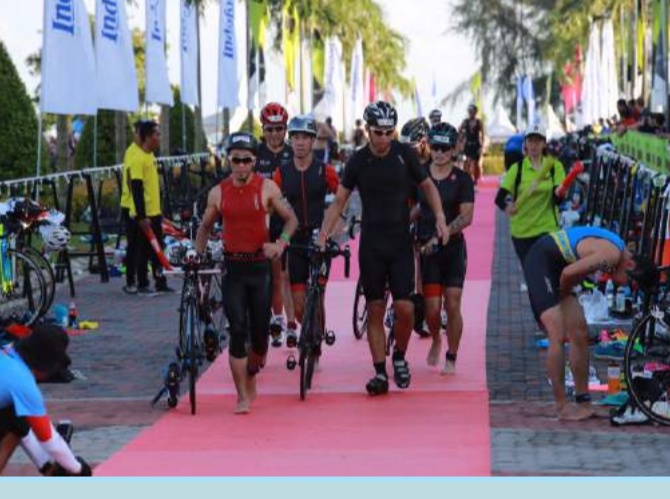
Peserta yang baru saja melewati rintangan berenang