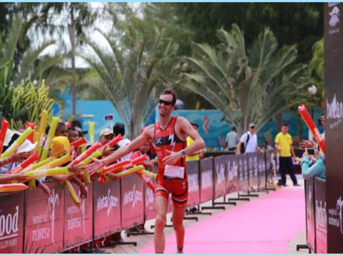
Salah satu atlet menyapa penonton saat hendak masuk garis finish

Rute balap Ironman 70.3 Bintan mengelilingi keindahan alam Pulau Bintan. Arena yang dilalui peserta tahun ini berbeda dari tahun sebelumnya. Kali ini dirancang sedemikian rupa agar lebih bervariasi.