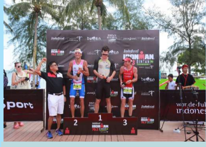
Winer Kategori Pria