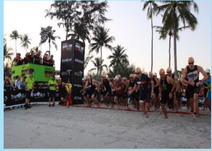
Peserta yang baru saja dilepas dari star