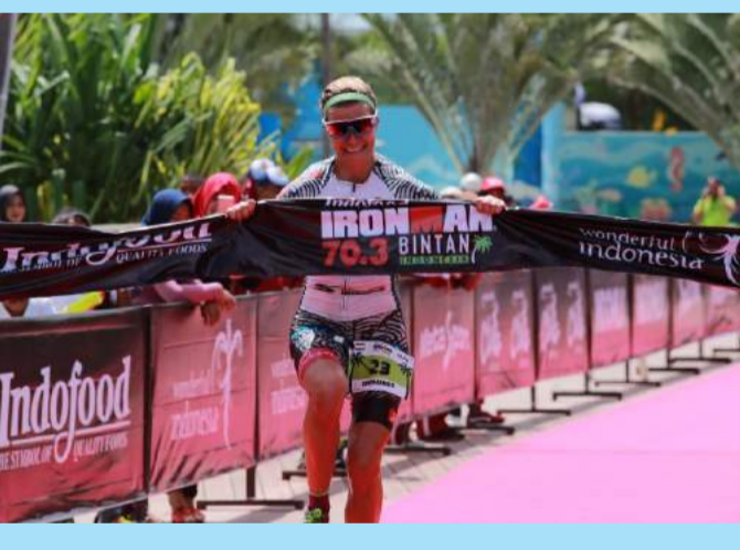
Senyum peserta memasuki garis finish